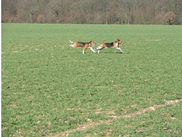
Beagles Harrier. Lot de M. Daniel JOURNET.