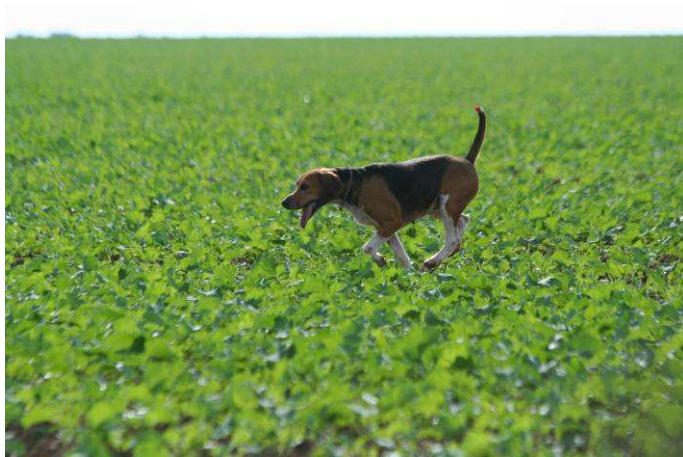
Beagle Harrier. Lot de M. Daniel JOURNET.