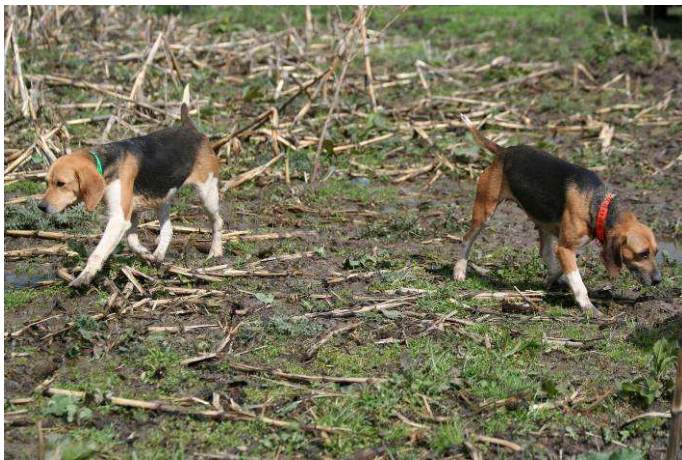
DURBAN & VENUS Beagles Harrier.