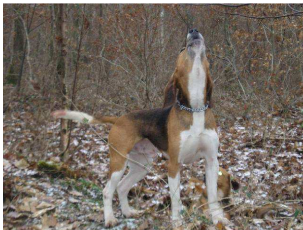
SCRACHT. Beagle Harrier. Lot de M. Daniel JOURNET.