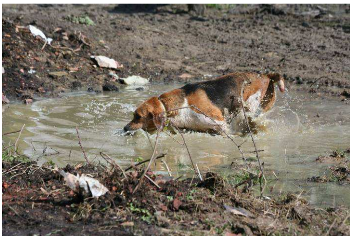
BALTIQUE Beagle Harrier. Lot de M. Pascal MARIGNIER.