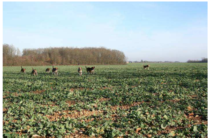
Beagles Harrier. Lot de M. Daniel JOURNET.